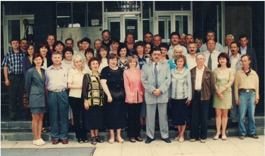
З колективом видавництва «Закарпаття» напередодні 25-річчя від дня його заснування, 2001 р.