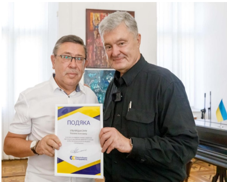
На зустрічі з п'ятим Президентом України Петром Порошенком, Ужгород, 2024 р.