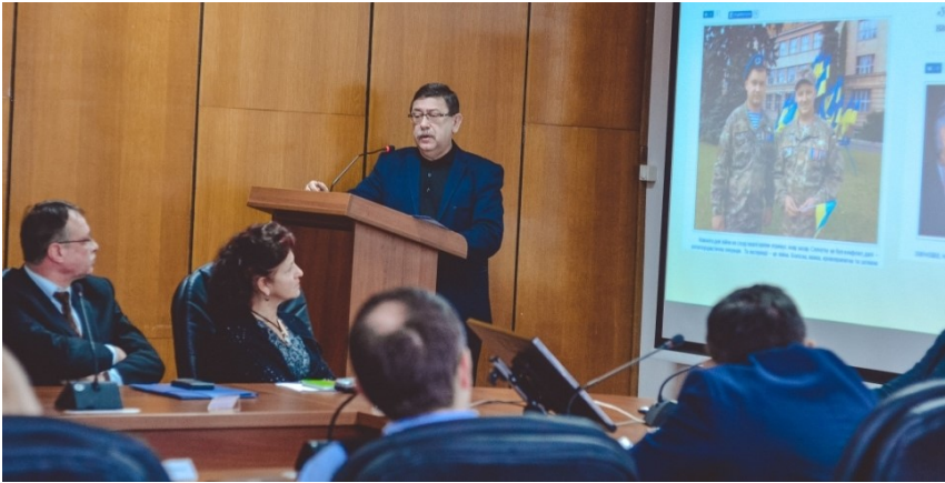
Виступ на Вченій раді Ужгородського національного університету, 2017 р.