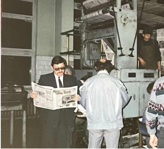
У друкарні видавництва «Закарпаття» з першим номером газети «Срібна земля-ФЕСТ», 1996 р.