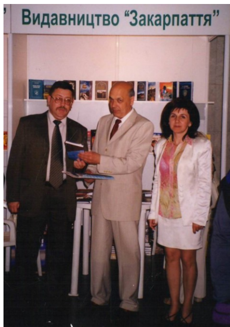
Стенд видавництва «Закарпаття» на виставці «Книжковий сад» у Києві щоразу відвідував голова ОДА Геннадій Москаль, 2002 р.