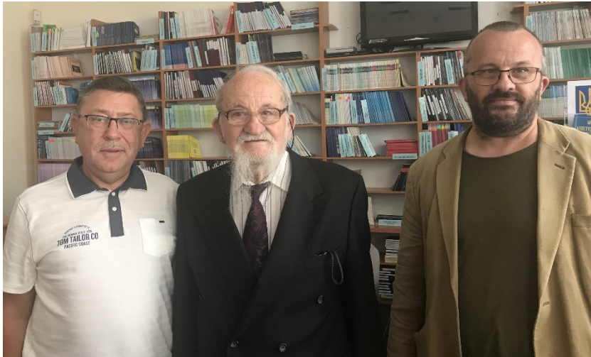
З академіком Миколою та професором Олесем Мушинками в Закарпатській обласній універсальній науковій бібліотеці ім. Ф. Потушанка, 2021 р.