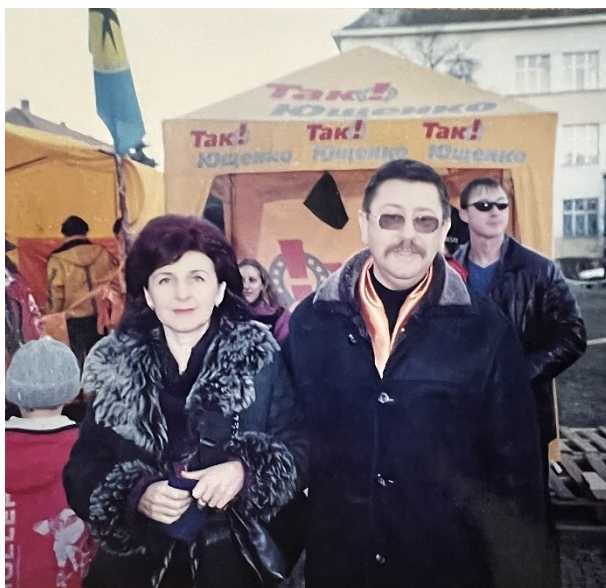
Помаранчевий Майдан в Ужгороді, 2005 р.