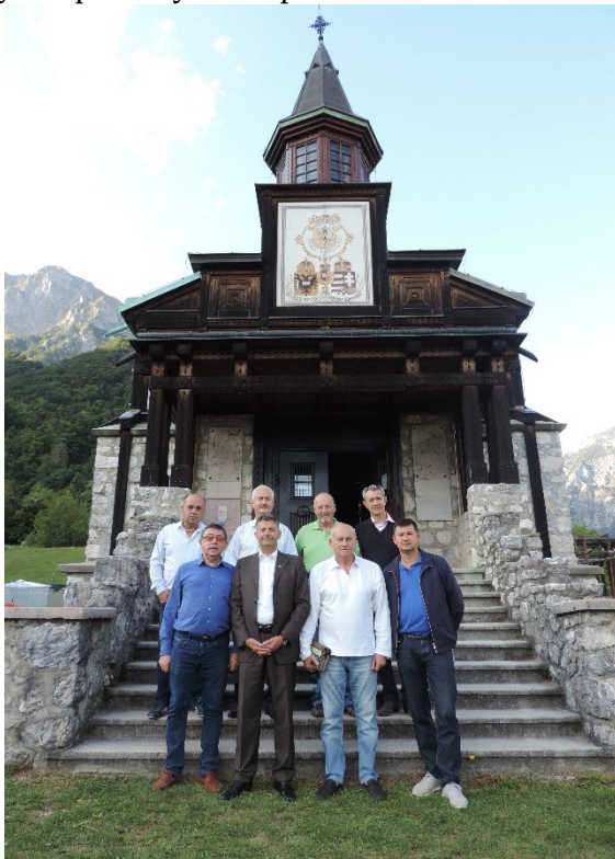
З колегами із Центру військово-історичних досліджень «Memento Bellum» біля поминальної церкви Святого Духа, зведеної під час Першої світової війни на горі Яворка в Юлійських Альпах (Словенія), 2019 р.