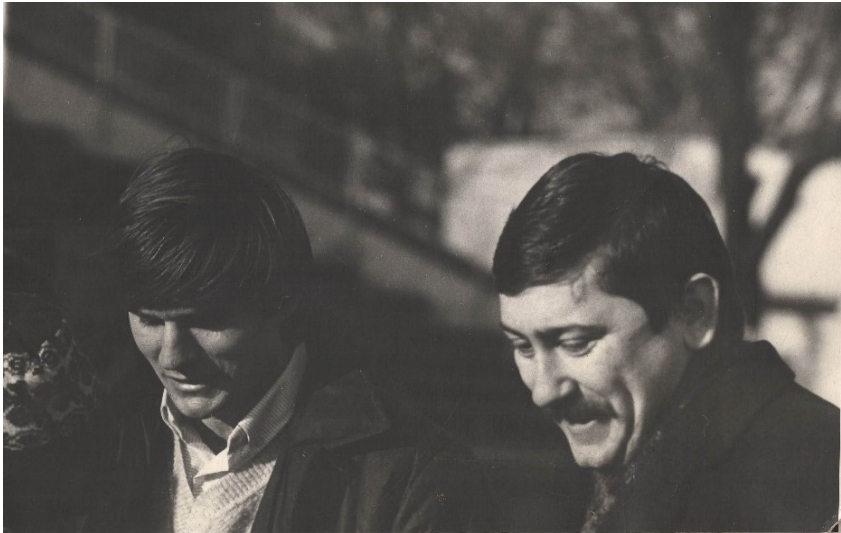
Інтерв'ю з футболістом київського «Динамо» і збірної СРСР, земляком Василем Рацом для телепрограми «Закарпаття вітає чемпіонів», 1985 р.